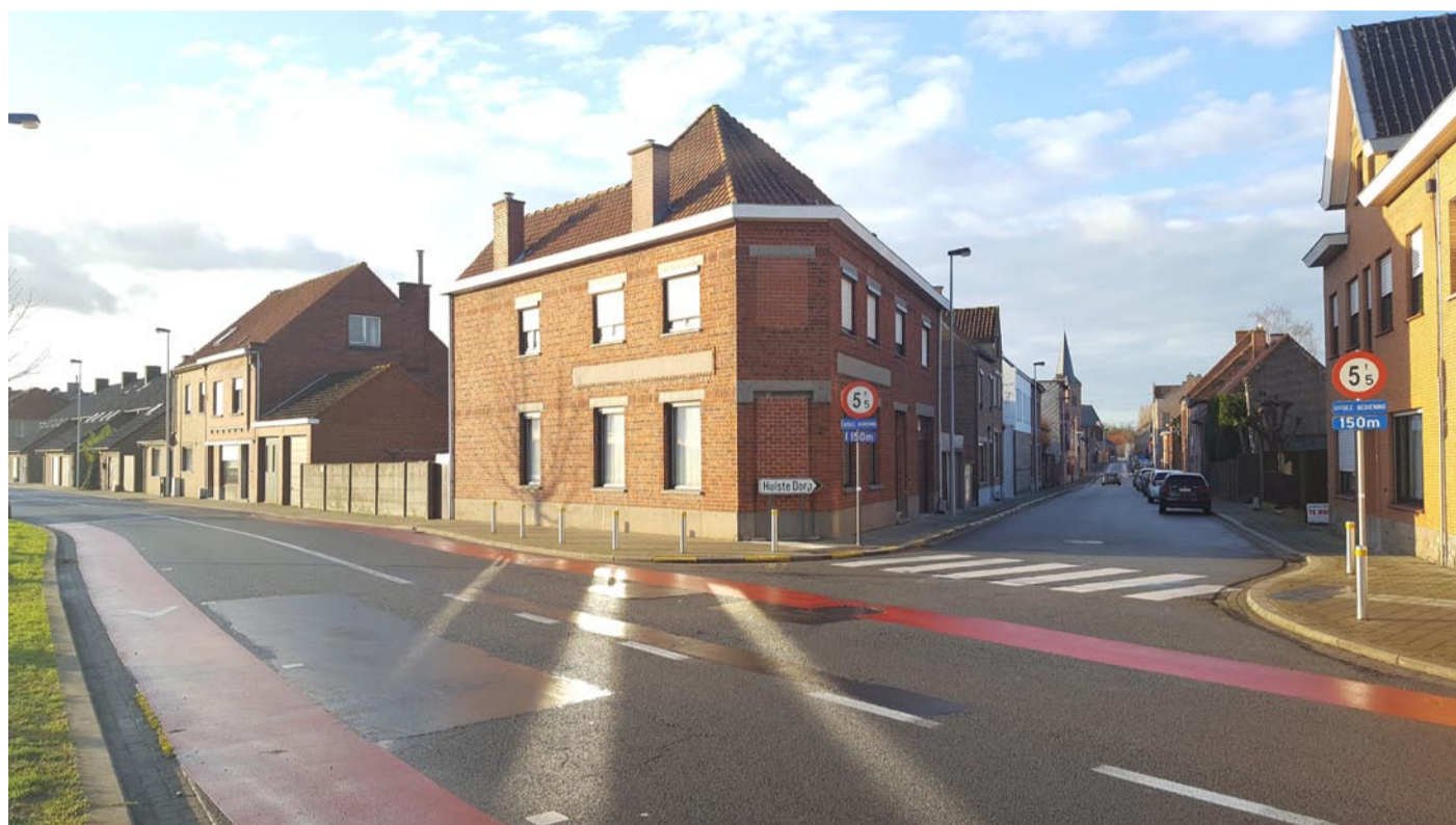
Situatie in 2018. De toegangsdeur tot het café werd dichtgemetseld en verplaatst naar de zijkant in de Kasteelstraat.