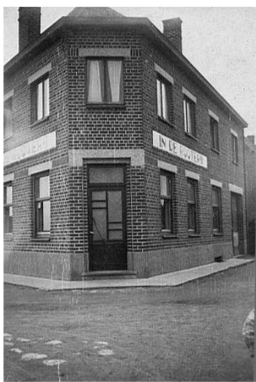
In de Rooterij